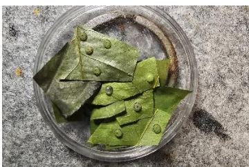
Eier vom M. peleides

Ich halte die Raupen in einem 5,7 l Eimer, der Klee wird jeden Tag gewechselt.