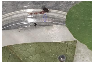
Rauper kurz nach dem Schlupf