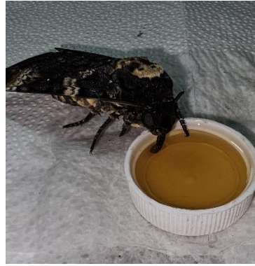
A. atropos bei der Nahrungsaufnahme