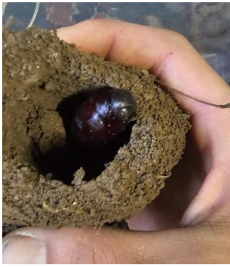
Kokon vom A. atropos