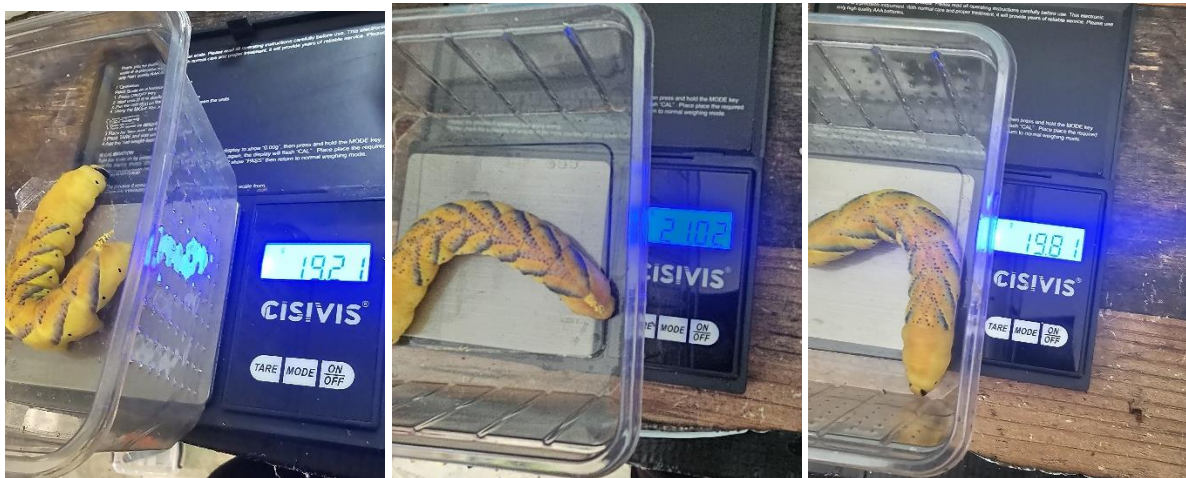
Acheronita atropos kurz vor der Verpuppung gewogen, und Dokumentiert.

Nach 21 Tagen also am 25.05.2024 hat sich die erste Raupe verpuppt, am 26.05.2024 haben sich die anderen 3 Verpuppt, bevor die Raupen sich verpuppt haben habe ich sie gemessen und gewogen alle 4 Raupen hatten eine Durchschnittsgröße von 10 – 11 cm. Und ein Durchschnittsgewicht von knapp 20 gr.